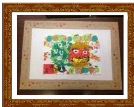
『輝け！獅子舞～新年の舞い』

県央福祉会後援会で毎年作成しているほっとアートカレンダー。その原画展が10月28日(火)～11月2日(日)に『かながわ県民センター』で開催され、中山みどり園からはなんと3点の原画が展示されました。(上記の3点です)！『なんてん』だとモノクロになってしまい、分かりづらいのですが(HPだとカラーでご覧いただけます)、青い糸をたくさん並べて、こいのぼりが泳いでいるように見せたり、本物のすすきを使ってリアリティーを追及したりと、どれも職員と利用者さんが試行錯誤をしながら、一緒になって取り組んだ作品ばかりです！またこの原画展には、中山みどり園の作品以外にも、県央福祉会の各事業所から、様々な作品が展示されていました。まさに芸術の秋にぴったりの原画展になりました。(乳井俊之)