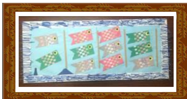
『みんなでおよげ！こいのぼり』