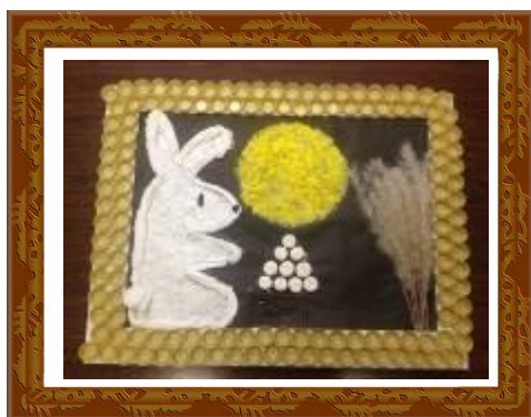
『きをつけうさぎ～満月がおいしそうです～』