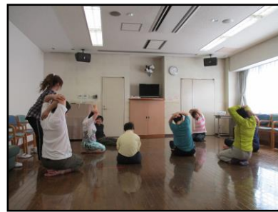
『ダンス』しっかりストレッチを行います。