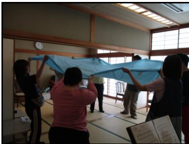
『音楽』メロディーに合わせて パラバルーンを膨らませます。