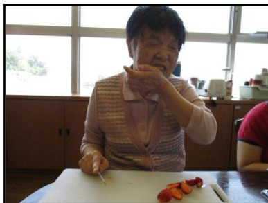
『調理』毎回、手軽で美味しいレシピを みんなで作ります。