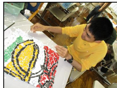
『創作』利用者さん一人一人の感性が 発揮されます。