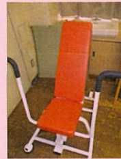
健康担当 トレーニング マシン

4月からみどり園の一員になりました。自動販売機です♪ もうみんな買ってくれたかな??これから暑くなるから水分補給はしっかりしてくださいね☆ 当たった人はラッキー☆