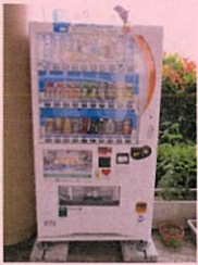
水分担当 自動販売機

4月からみどり園の一員になりました。自動販売機です♪ もうみんな買ってくれたかな??これから暑くなるから水分補給はしっかりしてくださいね☆ 当たった人はラッキー☆