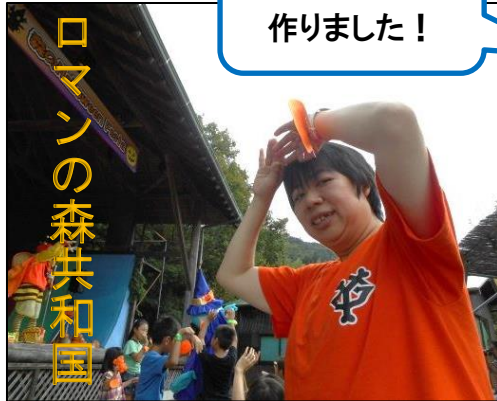
ネームプレート 作りました！