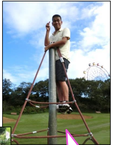
ドイツ村の アスレチックが 盛り上がった～