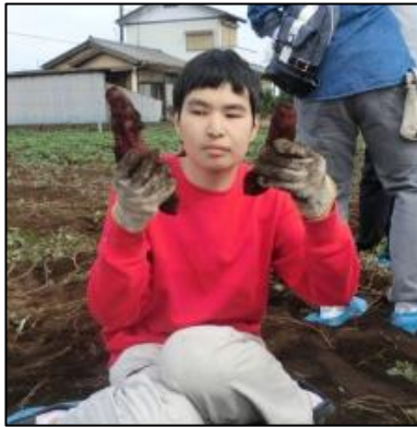
さつまいも掘りと 落花生収穫!!