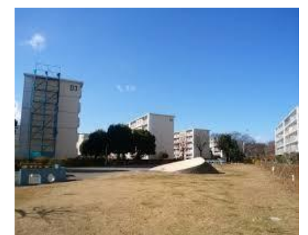
<グリーンハイツ中央広場>

<お知らせ> と手を握って話かけてくれました。「どうしたの?」と私が聞くと小さな声4月号でお知らせしましたおもちゃの寄付ですが、たくさんの寄付を頂きました。子ども達もとても喜んでいました。頂きましたおもちゃは若松保育園や他の施設で大切に使用して頂きます。寄付へのご協力、ありがとうございました。達との時間はとても大切で、お